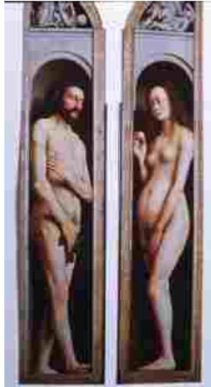
Resim 1:Jan van Eyck, Adem ile Havva, Tempera, 365 x 450 cm, 1426-1432

Fiziksel varlığımız düşünsel varlığımızdan önce gelen en ilkel biçimde kendimizi ortaya koyma biçimimizdir. Bir bebek dış dünyayı kendi vücudunda bıraktığı etkilerle algılar. Sobanın sıcak ve yanıcı olduğunu, bıçağın sivri ve kesici olduğunu dokunarak, test ederek ve bedeniyle nesnelere ilişkiye sokarak bulgular. Nesnelere vücudunda bıraktığı etkilerle onları basitçe iyi ve kötü olarak sınıflara ayırır. Bedenini konumlandırarak yerleri bu ayrımlara göre belirler. Ergenlik dönemiyle beraber bedenin geçirdiği değişim düşünceleri etkiler. Bu fiziksel gelişim kişinin cinsel kimliğine, güzellik ve çirkinlik kavramlarına yer bulur ve kişiliği belirleyen önemli taşlar yerlerine bedendeki değişimle birlikte oturur. Kısacası biyolojik bir sözcük olmaktan öte tenin tin ile ilişkisi düşünsel alanda yer bulur.