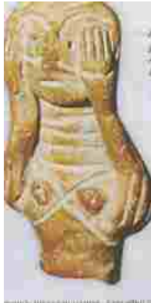
Resim 6: Anatanrıça Heykelciği, Afyon-Bolvadin Üçler Köyü buluntusu

Eski tunç çağı buluntusu figürler oldukça ilginçtir. Nadiren tasvir edilmiş erkeklerin yanı sıra çok miktarda kadın figürler bulunur. Bu figürler genelde yassı şekillendirilmiş, oldukça sade, hatta şematik bir biçimde, soyutlayıcı bir yaklaşımla tasvir edilmişlerdir. Bu figürlerin başları genelde yarım daire biçimindedir, memeler iki daire ile belirtilir. Daha da fazla soyutlanarak keman biçimini almış idollerde vardır. Bu geometrik ifadeli idoller yerel özellik gösterebilir de Neolitik ve Kalkolitik Çağ figürleriyle aynı amaç için yapılmışlardır: Dini inanış.