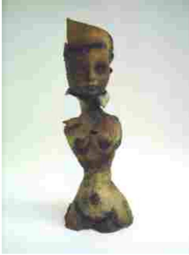
Resim 64: Kraliçe 3, 1200°C, 37x12x12 cm, 2005