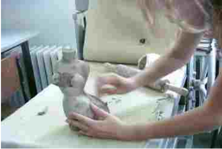
Resim 59: Rötüslama sırasında bir çalışma

ön planda tutulması olarak görülmüştür. Birinde beden gözlerden gizlenip bir üreme makinesine dönüştürülürken, diğesinde herkesin görmesi sağlanıp cinselliğinden yararlanılmaktadır. İki bedenin ortak noktaları; kadının en önemli simgesi cinsel organı ve göğüsleridir. Seramik çalışmalarda özellikle bu vücut parçaları ortaya çıkarılmıştır.