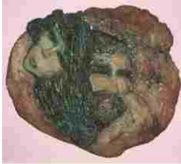
Resim 14: Ayfer Karamani, Pano