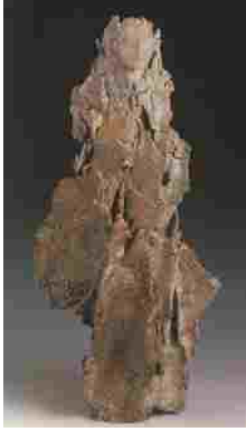
Resim 35: Carmen Dionyse, Mısırlı Mary, seramik, 59 cm, 2000

1938-1946 yılları arasında Königliche Güzel Sanatlar Akademisi’nde öğrenim görmüştür. 1958 yılında ise aynı okuldan Seramik Ana Sanat Dalında Mastır diplomasını almıştır. Belçika, Almanya, A.B.D., İsviçre, Japonya, Avusturya, Kanada, ...v.b. daha bir çok ülkenin önemli koleksiyonlarında ve müzelerinde eserleri bulunmaktadır.