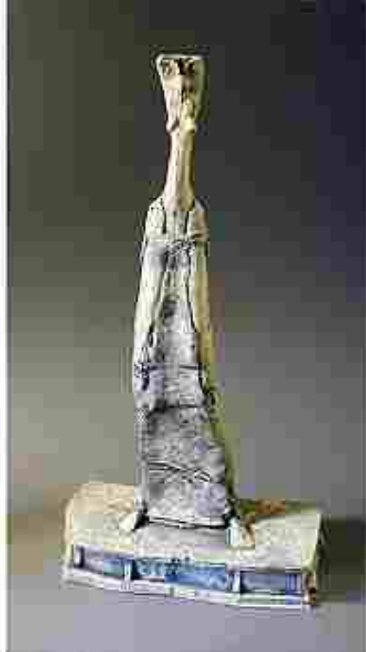
Resim 43: Mo Jupp, ayakta duran figür, stoneware ,45 cm

Halen Bristol’de ve Westminster Üniversitesi Harrow Sanat Okulu’nda eğitimlik yapmaktadır. 1960’larda figür çalışmaya başladı ve özellikle son otuz yıldır İngiliz Seramik Sanatı içinde aktif olarak yer almayı başardı. Victoria & Alber Müzesi ve Büyük Britanya El Sanatları Konseyi koleksiyonunda eserleri bulunmaktadır. Çalışmalarını ve yaşamını Londra’da sürdürmektedir.