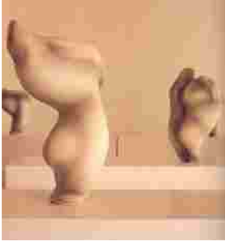
Resim 38: Wayne Fischer sergisinden bir görünüm

http://www.createdinfrance.com/pages/article.asp?ref=2696