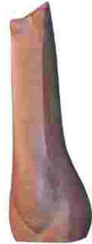
Resim 46: Karayığitoğlu, Hakkı, (1926 - ),Tors Vazo,Pişmiş Toprak, 45x17x16 cm

Eğitimini İstanbul Devlet Güzel Sanatlar Akademisi'nde ve Floransa Güzel Sanatlar Akademisi'nde tamamlamış olan sanatçı, heykel alanında çalışmalarını sürdürmüştür. Heykellerinde ağırlıklı malzeme olarak betonu kullanmaktadır. Seramik malzemedен yapılmış çalışmaları da bulunmaktadır.