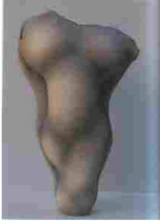
Resim 39: Wayne Fischer, No:2B, 70x43x27 cm, 1997

Kendisi çalışmalarını şöyle anlatmaktadır: ‘Çalışırken hislerimi kile aktarırım. Örneğin cinsellik, insanlar çalışmalarında görebilirler, gerçekte bilinçli bir element değildir. sadece sonsuzluğun olduğu yeni yaşam ile şehvetin arasındadır. Doğada özellikle sevdiğim formlar başlangıç olur. Renklerde yumuşaklık, formlarda incelik vardır.... Çalışmalarım soyutlama ve figüratif arasında ortada bir yerde durmaktadır’ (Waller, 2001, s:35). (Resim 39)