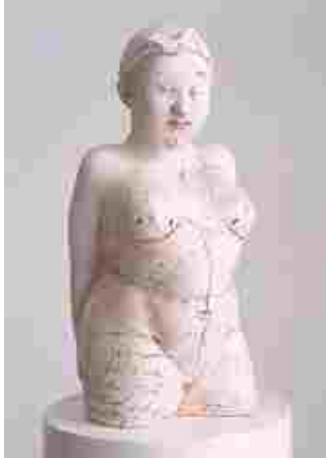
Resim 33: Gundi Dietz, Kadın, Porselen, 2002

Avusturya'nın en tanınmış sanatçılarından biri olan Gundi Dietz, küçük porselen figürlerinden, büyük boyutlu karışık teknik çalışmalara kadar değişen geniş bir yelpazede çalışmalarını sürdürmektedir. Uluslararası Seramik Akademisi üyesi olan sanatçı halen ülkesi Avusturya'da Enzersdorf'ta yaşamaktadır. Çalışmaları Amerika, Avrupa ülkeleri ve Japonya'nın önemli müzelerinin koleksiyonlarında bulunmaktadır.