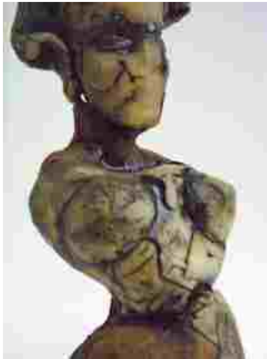
Resim 67: Kraliçe 4'ten ayrıntı