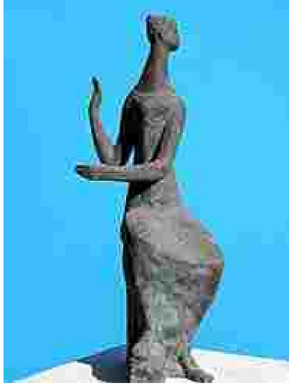
Resim47: Karayığitoğlu, ArmoniPişmiş toprak72 x 31 x 30 cm

Sanatçının soyutlanmış kadın bedeni çalışmaları yanında gerçekçi betimlemeleri de bulunmaktadır. ‘Hakkı Karayığitoğlu, kadına metaforik anlamlar yükleyen sanatçılardan’ ( http://sanalmuze.org/sergiler/contentz.php?imgid=4084&ic=75&sergi=585&pg=2&order=33 ).