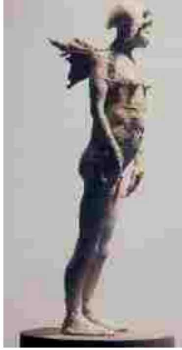
Resim 21: Herman Muys, Hebe, Seramik, 70 cm, 2001

Claire Curneen, malzemenin kullanılış biçimi ile bile dışavurumunu göstermektedir. Kırılgan ve gururlu insanları yaparken farklı bir karakter yaratmıştır. Onun figürleri vücut hatları ve baş ayrıntıları ile kendine özgü ve sanatçının öznel yaratımlarıdır. Ellerinin duruş biçimleri Curneen in hikayesi için bir araçtır. (Resim 20)