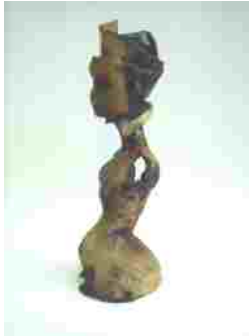
Resim 65: Kraliçe 3'ün yan görünüşü