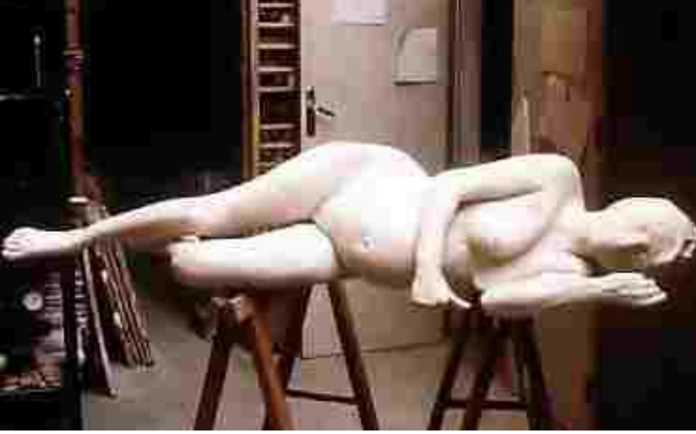
Resim 16: Gerard Bignolais, Kompozisyon, Seramik, 165 cm, 1990

http://bignolais.com/galerie/grenoble/pages/jb-1-8.html