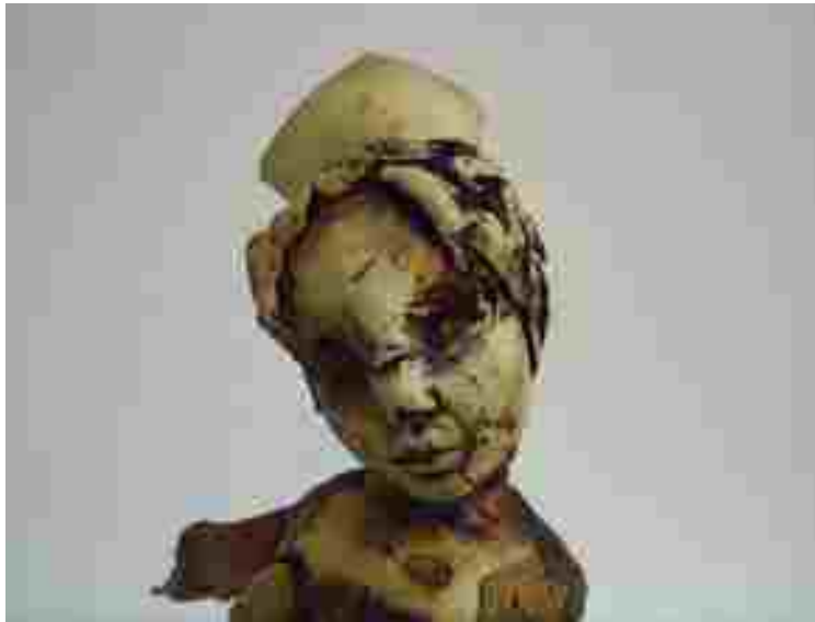
Resim 63: Kraliçe 2'den ayrıntı