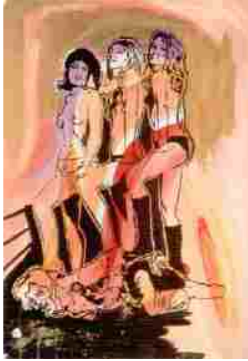
Resim 11: Sigmar Polke, Üç Kız, Kağıt üzerine karışık malzeme, 69,9x99,8 cm, 1979 Sanat Kitabı, 1997, s:365

kurtulmuşluğu ile sıkça ve kolayca bulabileceğimiz çıplak kadın bedenleri sayesinde beden oldukça karmaşık bir yapıya dönüşüvermiştir. Bütün bunlara karşın bugün günlük yaşamda ön plana çıkan kadın kendine özgü bedeni olandır ve 21. yy farklılığı ve özgünlüğü taşıyan bedenleri sevmektedir.