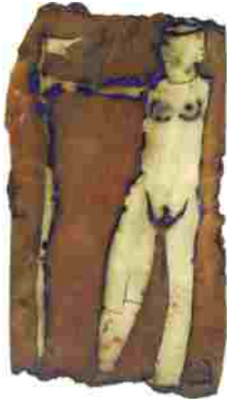
Resim 68: Plaka 1, 1200°C, 40x23 cm, 2005