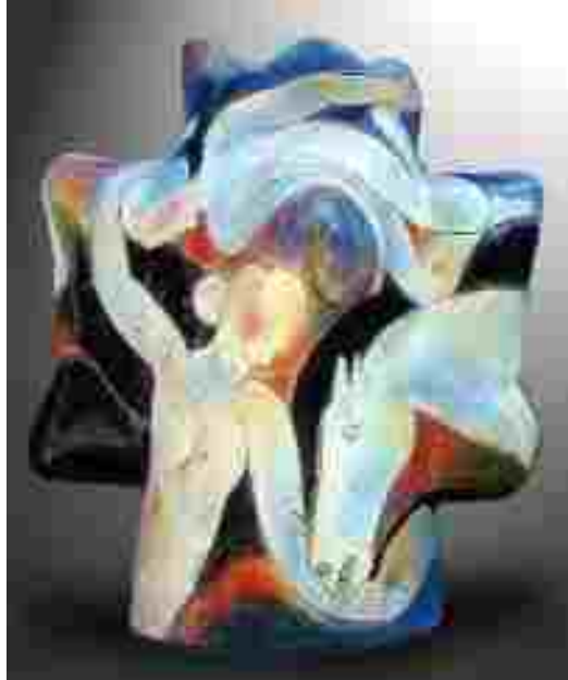
Resim 24: Rudy Autio, Mankato, sır üstü dekor, 35 x 32 x 25 inç, http://www.rudyaudio.com/Sales/Salesfrm.html

En tanınmış Amerikan seramik sanatçılarından biri olan Rudi Autio, 40 yıldır kendisini uluslararası platformda da kanıtlamıştır. Çalıştığı farklı malzemeler arasında bronz, cam ve işlenmiş metal de vardır. Daha çok figüratif vazoları ile tanınır. Bu figüratif vazoları dünyanın farklı yerlerinde çeşitli müze ve özel koleksiyonlarda bulunmaktadır. Montana-Missoula'da yaşamakta ve orada çalışmalarına devam etmektedir.