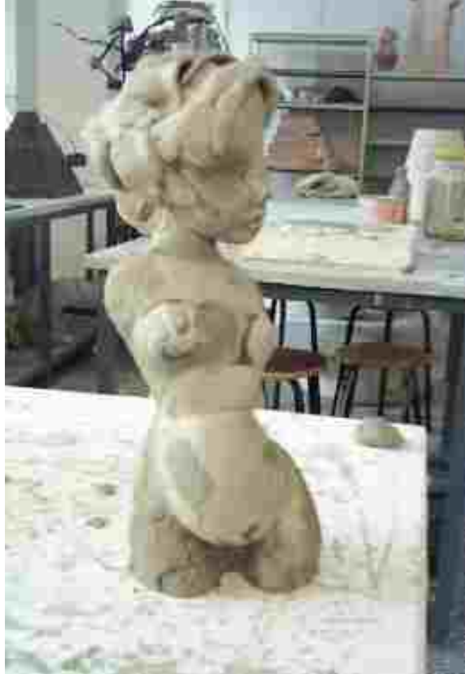
Resim 60: Bisküvi pişirimine girmeye hazır bir çalışma

Kurutma işleminin ardından bisküvi pişirimi yapılan heykeller sırlanmıştır. Sır olarak kahverengi ve siyah renkler tercih edilmiştir. Sür-sil yöntemiyle sırlanan parçalar 1200°C de pişirilmiştir.