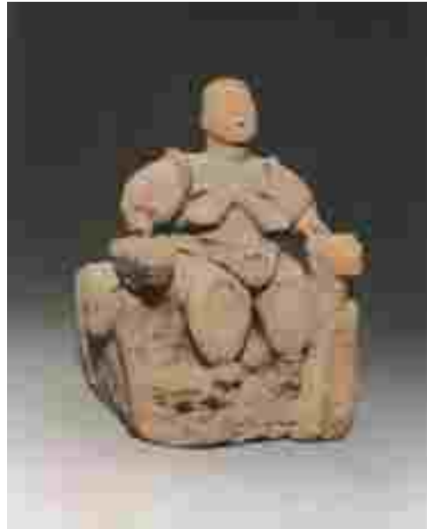
Resim 5: Leoparlı tahtında oturan tanrıça heykelciği, pişmiş toprak, 20 cm, M.Ö. 6.000

Bir Çatalhöyük buluntusu olan bu kadın figürü Anadolu'daki yüzlerce ana tanrıça heykelciğinden biridir. (Resim 4) “Krem rengi kilden yapılmış ana tanrıça heykelciği, çıplak olup, elleri dizlerinin üzerinde oturmakta. Baş kırılmış. Büyük göğüslerinin uçları ve göbek deliklerle gösterilmiş. Ellerde parmaklar derin çizgilerle belirtilmiş. Ayak bileklerindeki paralel kazıma çizgilerle halhallar gösterilmiş. Ayak işlenmemiş. Vücudun ön kısmında, kırmızı boya ile yapılmış, zig zag motiflerden oluşan bir bezeme var” (Anadolu Medeniyetleri Müzesi Kataloğu,s:166).