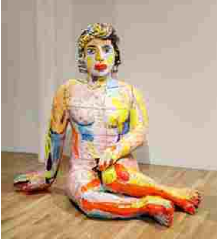
Resim 40: Viola Frey, Oturan Kadın, Seramik, 67 x 72 x 49 inç, 2002

1953 yılında California Collage of Art and Crafts okulundan, 1956 yılında Louisiana'da Tulane Üniversitesinden master derecesi alan sanatçının birçok önemli müze koleksiyonunda çalışmaları bulunmaktadır. 1974 yılından beri yaklaşık 40 kişisel sergi açan ve birçok karma sergiye katılmış olan Viola Frey halen California'da yaşamakta ve çalışmalarını sürdürmektedir.