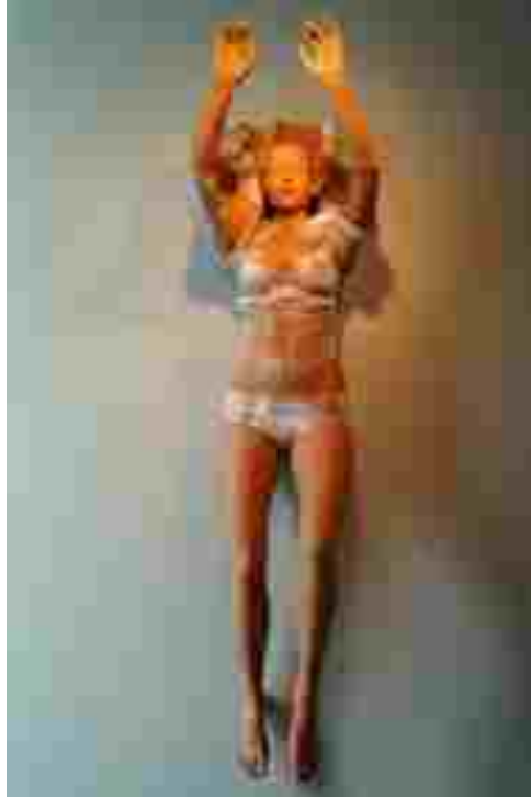
Resim 57: Kathy Venter, Immersion Serisinden-3, terra-cotta, 182 cm

Figürler üzerindeki giysiler figür için de izleyici için de hiçbir anlam ifade etmemektedir. Figürlerdeki etkiyi kuvvetlendirmek adına derin gölgeler yaratır, kasları ya da duruşu kapatmaz, tam tersine daha çok ortaya çıkartır.