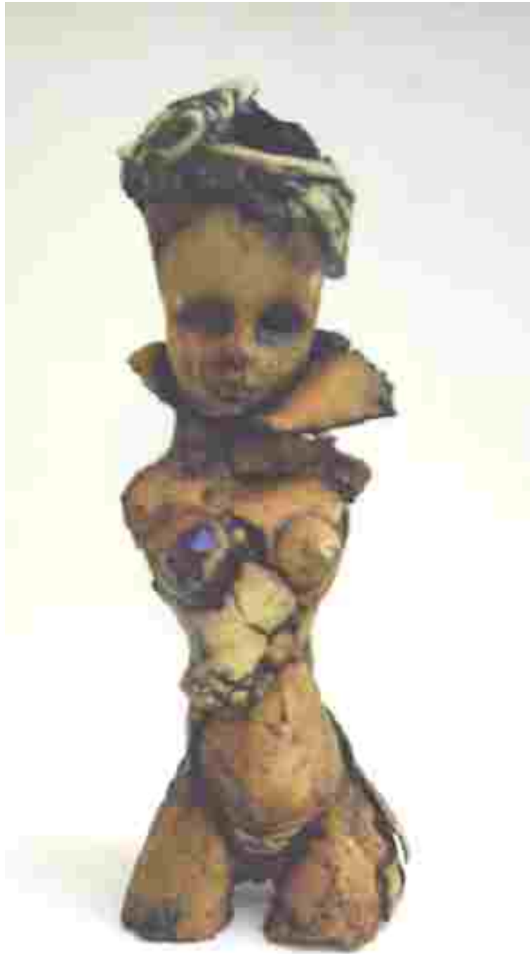
Resim 61: Kraliçe 1, 1200°C, 39x11x11 cm, 2005