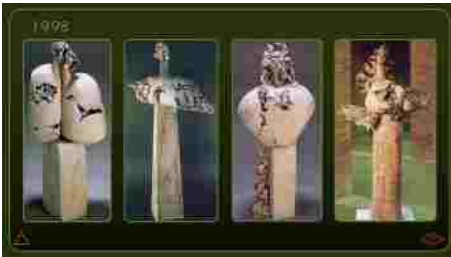
Resim 13: Erdiñ Bakla, Seramik Figürlerinden Örnekler