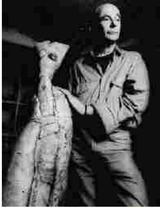
Resim 44: Mo Jupp çalışmalarından biriyle

‘Mo Jupp Uzun yıllar boyunca kadın figürü üzerine konsantre olmuştur. Bundan önce, 1960ların erken dönemlerinde el yapımı deneysel işlerden oluşan geniş bir yelpaze sunmuştur. O’nu 1978’den bu yana meşgul eden kadın figürü gerçekten süreklilik göstermiş ve odaklandığı düşünceleri dışa vurmak için çamuru nasıl kullanması gerektiğine dair daha iyi yollar arama çabasında olmuştur. Arkaik duygulardan ve çapraz kültürlerin geniş çeşitliliğinden etkilenmiş ve geleneksel oyulmuş çamur tekniklerini kullanarak çamura deneysel bir kolaylıkla hakim olmuştur.’ (Blandino, 2001, s:107) (Resim 45)