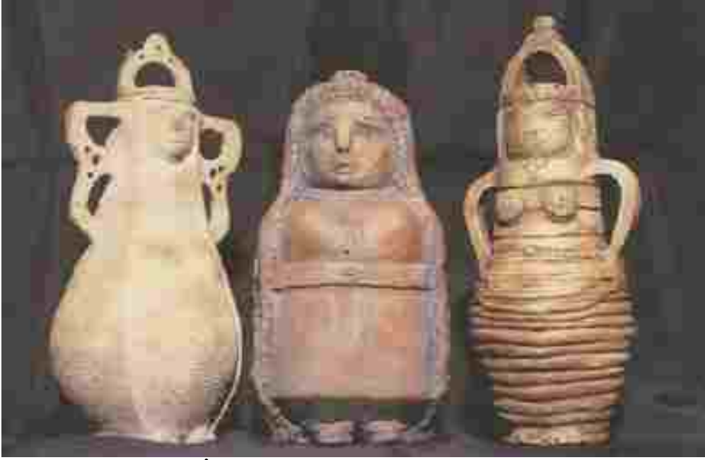
Resim 42: Nasip İyem, kadın şeklindeki testiler, çömlekçi çamuru

Çocukluk yıllarını geçirdiği Gönen’de, çömlekçilik yapan annesinin kuzenleri sayesinde seramikle tanıştı. 1958’de Eczacıbaşı’nın Karaköy’de Mumhane Caddesi’nde bir seramik atölyesi kurduğunu öğrenince buraya başvurdu ve seramik üzerine resim çalışmaya başladı.