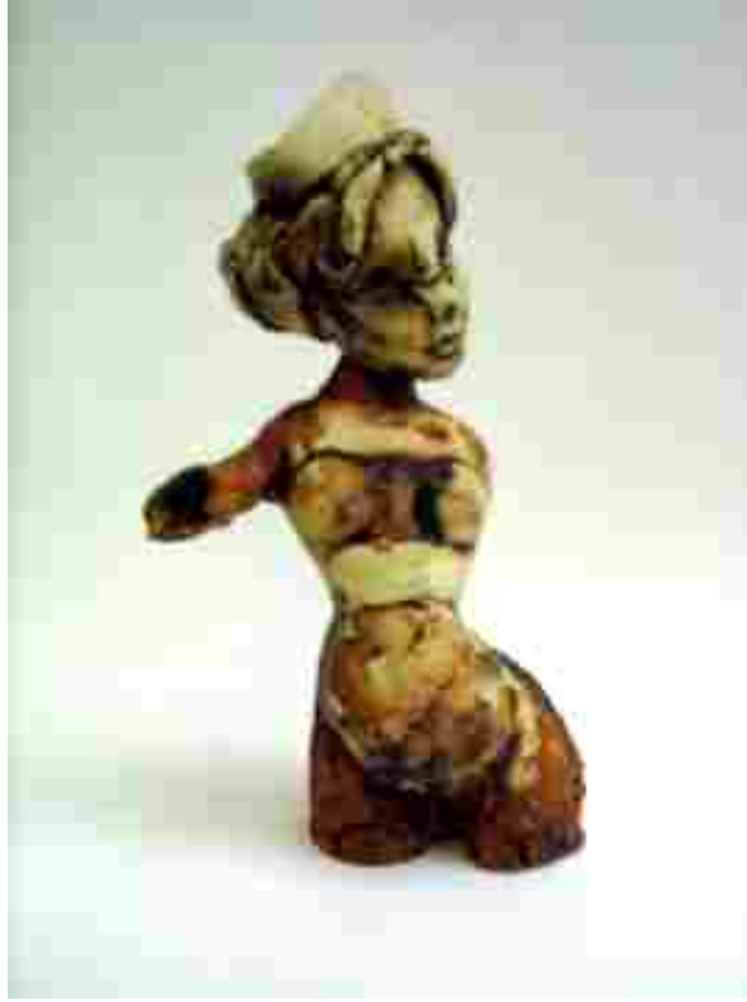
Resim 62: Kraliçe2, Seramik, 32x12x11cm, 2005