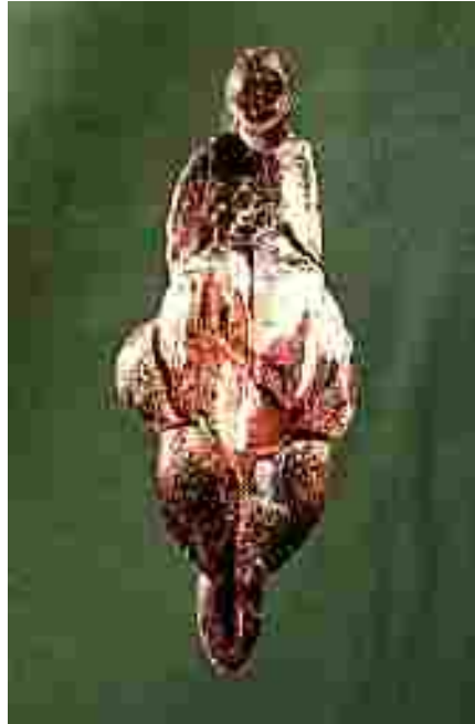
Resim 2: Lespugue Venüsü, Fildişi, 14.7 cm, M.Ö. 30.000-5.000

Bu heykelciklere genel olarak Venüsler denilebilir. Dünyanın ortak kültür mirası bu kadın heykelciklerinden, farklı coğrafyalarda çağın ve şartların gerektirdiği gibi farklı malzemelerle yapılmış olanları bulunmaktadır. Bunlardan en eski olanları Lespugue Venüsü, Willendorf Venüsü, Abri Pataud Venüsü, Laussel Venüsü, Impudique Venüsü, Gagarino Venüsü ve Anadolu'daki pişmiş topraktan yapılmış ana tanrıçalardır.