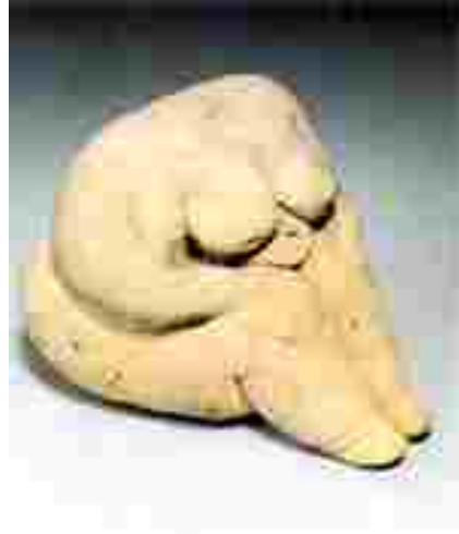
Resim 4: Ana tanrıça