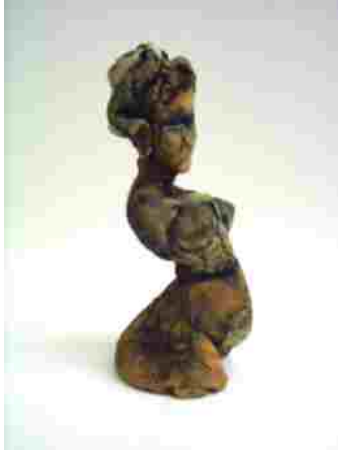
Resim 66: Kraliçe 4, 1200 °C, 28x13x13 cm, 2005