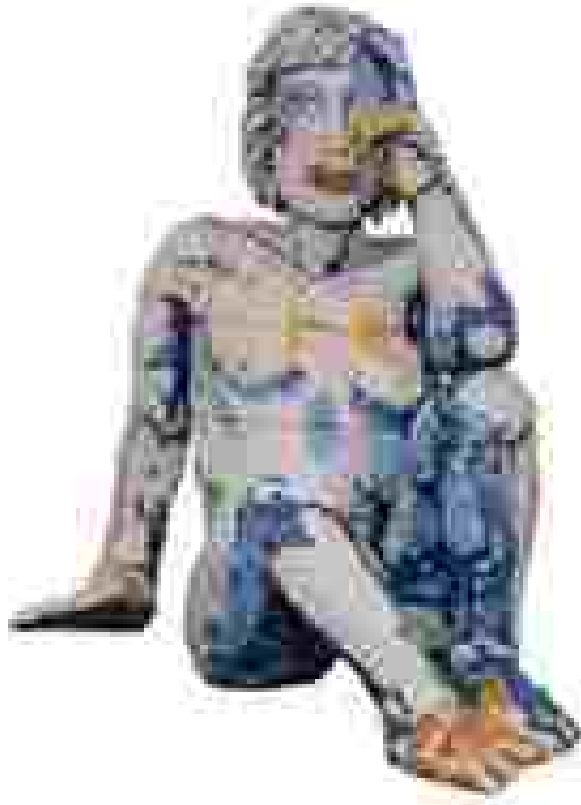
Resim 41: Viola Frey, Ağlayan Kadın, Sırlı Seramik, 193.0 x 147.3 x 203.2 cm, 1990

Halen çalışmalarını kendi özel atölyesinde sürdüren sanatçı Amerika’nın en tanınmış seramik sanatçısı sayılabilir.