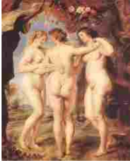
Resim 9: Peter Paul Rubens, Üç Güzeller, ahşap üzerine yağlıboya, 221x181 cm, 1639

üç tanrıça, Athena, Aphrodite ve Hera pek etli butludurlar. Rubens, Yunan mitolojisinde yer alan bilinen ilk güzellik yarışmasını görselleştirirken Boticelli'nin yere basmıyormuş gibi gözüken hafif çıplaklarının aksine ağır vücutlar betimlemekten çekinmemiştir” (Şenyapılı, 2003, s:33).