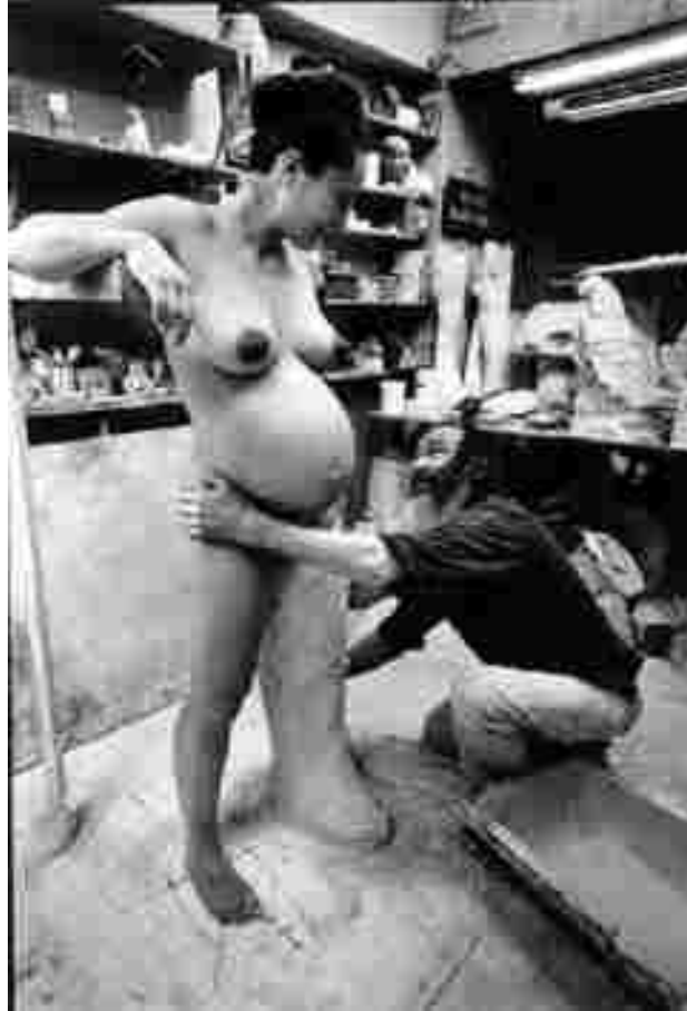
Resim 28: Bignolais modeli üzerinde çalışırken, 1997

Bignolais, modellerinin gönüllü olmasına özen gösteren bir sanatçıdır. Çünkü modellerinin her ayrıntısını tüm çıplaklığıyla seramik heykelinde yansıtır. (Resim 27) Hem bedensel hem duygusal duruşları, yüzlerindeki ifade, kızgın ya da mutlu oluşları, bedenlerinin her ayrıntısı, cinsel organları, tüy diplerindeki noktacıklar, yağlı vücutları, her şey tüm açıklığı ve çıplaklığıyla ortaya dökülür.