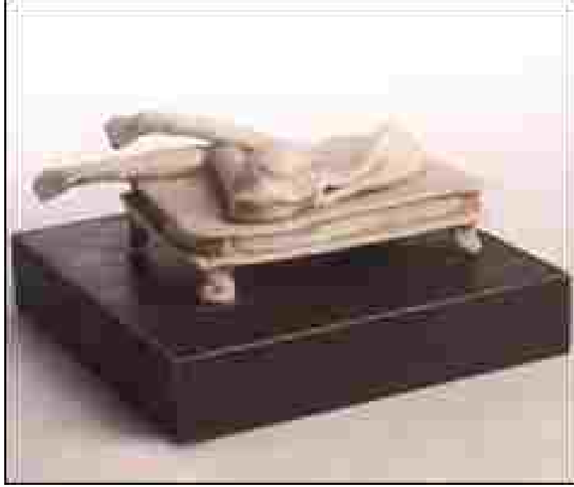
Resim 17: Mo Jupp, Uyku, Seramik, 8 inç, 1998

Dışavurumculuk (ekspresyonizm) “ 1905-30 yılları arasında Almanya da yoğunlaşan bir sanat yaklaşımıdır. Dışavurumcu sanatçılar dış dünyayı yansıtmak yerine içsel duygularını dışavuran resimsel biçimler geliştirme yolunu seçtiler” (Sanat kitabı, 1997, s:507). Adından da anlaşılacağı gibi dışavurumculuk akımı ile ortaya koyulmuş çalışmalarda sanatçının iç dünyası açığa çıkar. Korkusu, savaşı, mutluluğu, hırçınlığı, durgunluğu... v.b. tüm duyguları modelle birleşerek sanat eserinde ortaya konmuş olur.