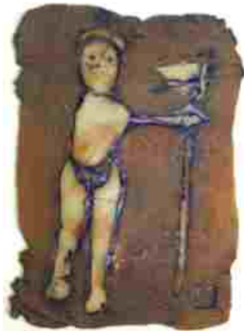
Resim 69: Plaka 2, 1200°C, 35x26 cm, 2005