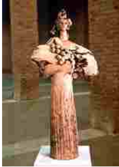
Resim 12: Erdiñ Bakla, Figür, Seramik (Toprak Sanat Sergisi Katalođu, s:10)

olan Füreyya İstanbul Darülfünü'nda felsefe öğrenimi gördü' (Thema Larousse, 1993, s:375). Füreyya Koral'ın seramikleri incelendiğinde seramiklerinde zeminin ve sırnın ayrı ayrı önem taşıdığı görülmektedir. Birbirinden farklı biçimlerde çalışmış olan sanatçının tabakları, heykelleri, büstleri ve duvar panoları vardır. Türkiye'de ilk özel atölyeyi kurarak çalışmalarına başlayan Füreyya Koral'ın kendi özel yaşantısına dair anlattığı birer hikaye sayılan kadın figürleri sanatçının duygularının bir aynası gibidir. Hamile iken çocuğunu kaybeden sanatçı bunu seramikten yaptığı içi boş insanları ile anlatmıştır. _