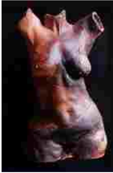
Resim 27: Gerard Bignolais, Grès Mélangé, tuz sırası, 68 cm, 1997

1971'den beri profesyonelce sergiler açmaktadır. Bu sergilerinde şehir olarak daha çok Paris'i tercih etmektedir. Gerçek bedenlerden alınmış kalıplara çamuru basarak şekillendirdiği figürlerini tuz sırasıyla sırlamaktadır. Halen Fransa-Antony'de yaşamını sürdürmekte ve çalışmalarına devam etmektedir.