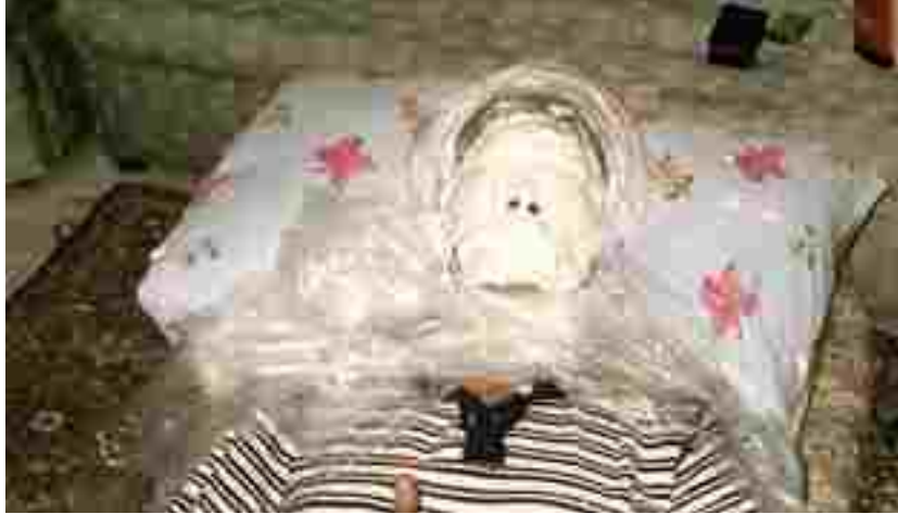
Resim 58: Modelin alçı ile yüzünün kalıbı alınırken

İnsan figürü ve kadın figürü uygulamaları incelenerek ülkemiz örnekleri ve dünya örnekleri arasında bir karşılaştırma yapılmıştır. Türkiye Neolitik Çağ dönemleri açısından oldukça zengin ana tanrıça buluntuları, dolayısıyla insan figür uygulamaları olmasına rağmen uzun yıllar boyunca İslam dinin etkisi ile körelmiş bir figüratif sanat saptanmıştır. Cumhuriyet yılları ile başlayan çağdaş seramik sanatına kadar seramik örneklerde insan figürü ve çıplak kadın figürü uygulamalarına oldukça az rastlanmıştır. Cumhuriyetin kurulması ile desteklenen çağdaş seramik sanatında incelenen figür örneklerindeki ağırlık merkezi ana tanrıça kültürüne göndermelerde bulunan çalışmaların çoğunlukta olduğu eserlerdir. Genel olarak tercih edilmiş ana tanrıça formunun dışında çalışılmış insan figürü ve çıplak kadın figürü örneklerinin az sayıda olmasının eksikliği hissedilmiştir. Bu durumdan yola çıkarak çalışılan çıplak kadın formları biçimlenirken kadının bu günkü sosyal yapıdaki yeri ve buna bağlı olarak şekillenen bireysel psikoloji esas alınmıştır. Değerlendirme yapılırken iki uç nokta incelenerek, aradaki gerilimle birlikte tasarımlar ortaya konmuştur.