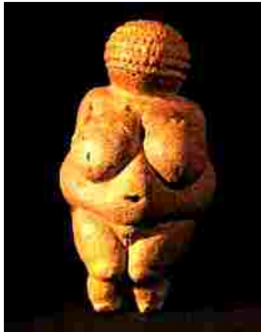
Resim 3: Willendorf Venüsü, Kireçtaşı, 11cm, M.Ö. 30,000 - 25,000

( http://www.arthistory.sbc.edu/imageswomen/lespugue.html ).“Bir mamutun dışından oyulmuş olan heykel 27.000 yaşındadır” ( http://encarta.msn.com/media_92150008_7615559 ). Oldukça yıpranmış bir biçimde bulunmuştur. Kadının bir hayat verici olarak bilinmesi nedeniyle ana tanrıça inanışına uygun olarak yapılmıştır. “Kadın vücudu bu heykelde, bir takım yuvarlakların, küreciklerin üst üste yığılması şeklinde tasvir edilmiştir” ( http://www.geocities.com/enveryolcu/sanat/dogus.html ). Memeler karnını örtecek kadar büyük, göbek hamile bir kadınıki kadar şişkindir. Baş ayrıntısına girilmemiştir. Soyut bir anlayışla şekillendirilmiş heykelcik sadece imgeyi hafızada taze tutmaktadır. Orantıları ve ölçülerdeki uyumlu estetiği nedeniyle çağdaş bir heykeli andırmaktadır.