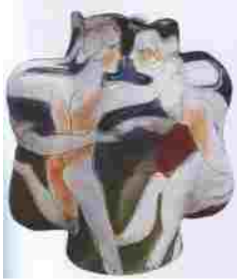
Resim 25: Rudy Autio, Metafor, seramik, 75x73,5x54,5 cm, 1998

Rudi Autio'nun seramik formlar üzerine çalıştığı figürler yalnızca kadınlar değildir. O'nun figürleri zaman zaman erkek, zaman zamanda attır. (Resim 24) Kolları bacakları dengede duramayan bir insan gibi sağa sola açılmış bu figürler sanki bir rüyanın parçasıymış gibi renkler ve çizgilerle belirtilmiştir. Sanatçının bu figürlerinin kaynağı Amerikan Western (Batı) kültüründen gelmektedir. Kendi derin tecrübeleri, farklı duygularıyla, yaşadığı ülkenin