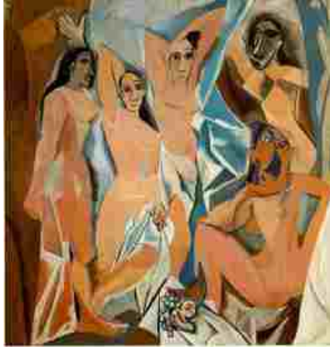
Resim 10: Pablo Picasso, Avignonlu Kadınlar, tuval üzerine yağlıboya, 244x234 cm,1907

Maillol'un kadınları naif olmakla birlikte cüretkar olarak nitelendirilebilir. Hayatında ve resimlerinde kadınlardan vazgeçemeyen diğer bir sanatçı Pablo Ruiz Picasso (1881-1973) dur. Kadınlar üzerine yaptığı birçok resim, heykel ve seramik vardır. 'Sanat yaşamı boyunca dönem çeşitliliği ile zengin Picasso'nun 1905 sonrası, başka bir deyişle, doğalcı olarak çalıştığı yılların sonrası hemen bütün dönemlerdeki kadın figürleri ve elbette kadın çıplakları görseli değil kavramsalı yakalamak amaçlıdır' (Şenyapılı, 2003, s:80) Bitmemiş olduğu halde sanat tarihinde önemli bir yer edinmiş olan Avignonlu Kızlar tablosu da Picasso'nun kadınlara karşı kavramsal bakışıdır. (Resim 10)