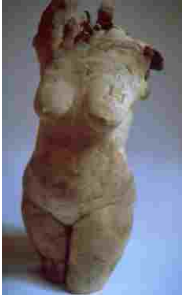
Resim 53: Helen Ridehalgh ,Tors III, el ile şekillendirme, 1260 C°, 35cm, 1994

Helen Ridehalgh'ın seramikleri yakından incelendiğinde, heykellerinin inceliği, çalışmalarının ne kadar yoğun bir çaba, ustalık ve deneyimle gerçekleştiğinin kanıtı olurlar. Heykelin kırık uzuvları antik dünyadan kopup gelmiş bir bronz heykeli anımsatır. (Resim 53) Genel olarak da heykellerinin bronz ağırlığı ve kalitesine yakın olduğu söylenebilir.